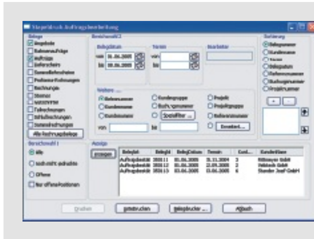
Über den Stapeldruck lassen sich Belege nach bestimmten Kriterien filtern, sortieren und „im Stapel“ oder als Liste ausdrucken.